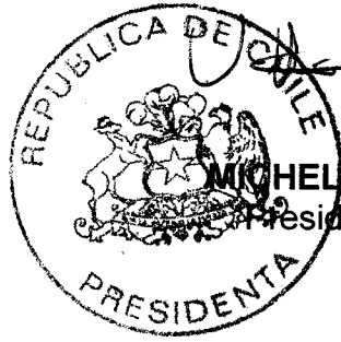
MICHELLE BACHELET JERIA Presidenta de la República

Sin otro particular, le saluda atentamente,